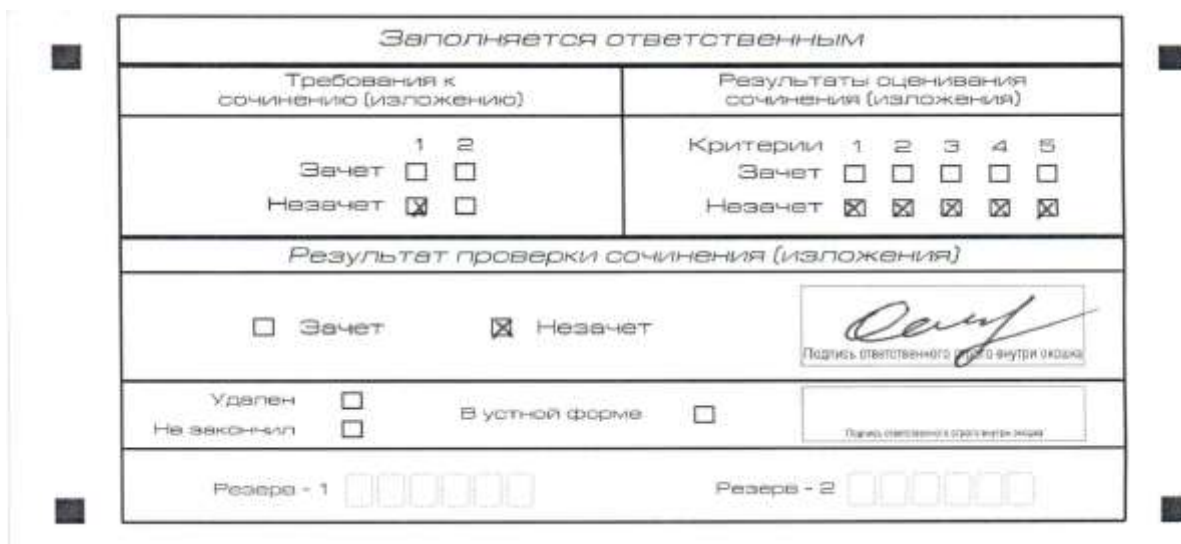
Рис. 7. Область для оценки работы

Эксперт комиссии (ответственное лицо, технический специалист 1 ) выставляет «незачет» за невыполнение требования № 2. В клетки по всем критериям оценивания выставляется «незачет». В поле «Результат проверки сочинения (изложения)» ставится «незачет».