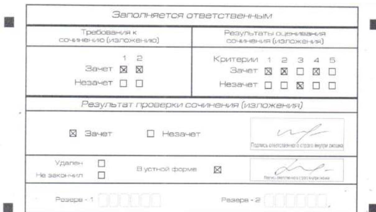
Рис. 9. Область для оценки работы сочинения (изложения) в устной форме

После окончания заполнения бланка регистрации ответственное лицо ставит свою подпись в специально отведенном для этого поле.